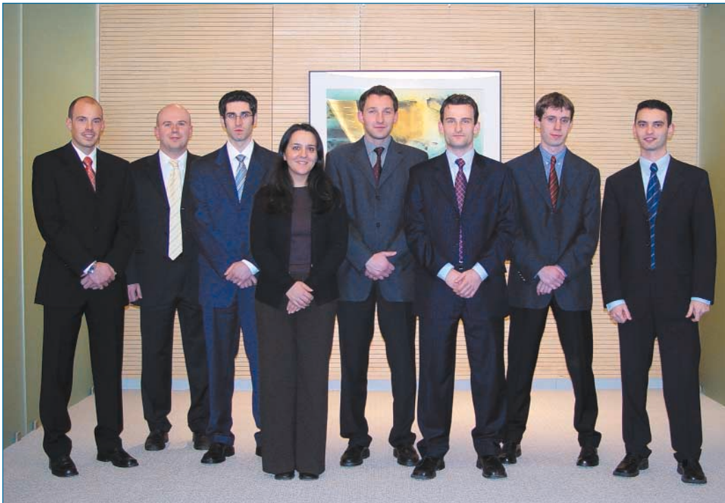
Service « Surveillance des banques » - agents engagés en 2002